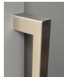
detail kotevních částí madla typu JHR na rámu dveří s podložkou nebo bez podložky (volitelně)