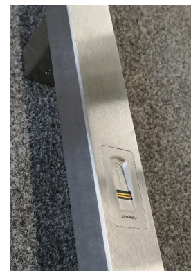
detail skeneru (čtečky)