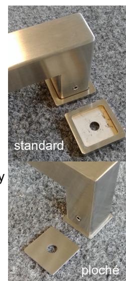
detail hranatých podložek

nerez 1.4301, obvyklé provedení úchop = profil 30x20 zakončení k rámu (nožička) 30x30 rozměr = rozteč vrtání RZ 230, 350, 650, 1000 / HL = 70 (příklad značení JHR30x20-350) pro větší RZ (nad 1800 mm) používáme úchop 30x30, 40x30, 40x40 a větší standardní zakončení k rámu profil 30x30 u větších rozměrů 40x40 zakázkově lze volit jiné rozměry či profily případně kombinace profilů podložky volitelné u větších rozměrů madel děláme podložky skryté