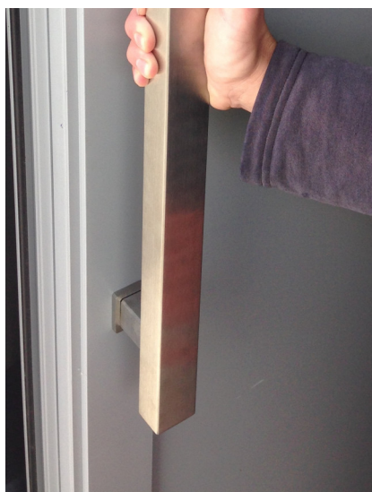
zobrazený model typ FHR40x40-700/550 vč. hranatých podložek