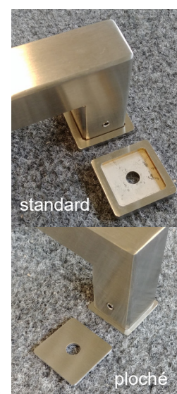
detail hranatých podložek

madlo typ FHR nerez 1.4301, obvyklé provedení úchopná část = profil 30x20 nožičky = 30x30 rozměr = délka/rozteč kotvení DL/RZ 500/350, 700/550, 1000/850, HL = 70 úchopná (rovná-dlouhá) část lze i z profilu 30x30, u větších délek 40x20, 40x30, 50x30 až 100x20 rozměry volitelné