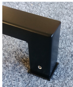
detail hranatých podložek

madlo typ JHR nerez 1.4301 povrch prášková barva černá matná RAL 9005 úchop = profil 30x20 zakončení k rámu (nožička) 30x30 rozměr = rozteč vrtání RZ 350 nebo 650 / HL = 70 (příklad značení JHR30x20-350)