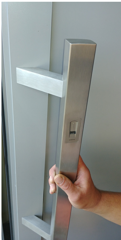
zobrazený model typ FZHR43 bez podložek (součástí madla jsou i hranaté podložky)

Tato firma i zprovozní celý systém. Případně můžeme dodat madlo bez čtečky, jen s drážkou.