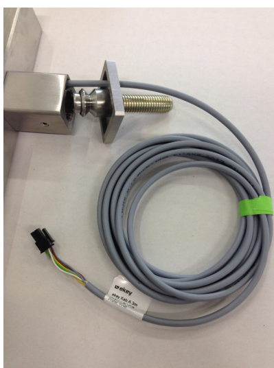
vývod kabeláže volitelně z horní či spodní kotevní nožičky ilustrativní foto rovného madla typ FHR 2 typy kabelů (černý nebo šedý) možné délky 2,5 / 3,0 / 3,5 m