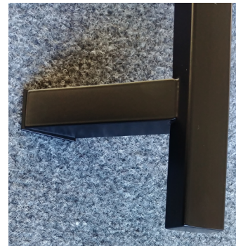
detail nožičky s podložkou

madlo hranaté - vyosené typ FZHR 1.4301 nerez profil masivní nerezové úchyty vše lakováno do černé matné barvy doporučené rozměry DL / RZ (mm) * 1000 / 850 * 700 / 550 * 500 / 350 volitelně i jiný rozměr