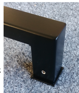
detail hranatých podložek

madlo typ JHR nerez 1.4301 povrch prášková barva černá matná úchop = profil 30x20 zakončení k rámu (nožička) 30x30 doporučené rozměry RZ (mm) * 850 * 650 * 350 volitelně i jiný rozměr