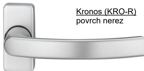
Kronos (KRO-R) povrch nerez

použití: -samostatné venkovní madlo -venkovní zámková rozeta -vnitřní jednostranná klika s vratnou pružinou -vnitřní zámková rozeta klika a rozety na obdélníkových rozetách