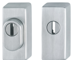
venkovní rozety viz. nabídka rozet

použití: -samostatné venkovní madlo -venkovní zámková rozeta -vnitřní jednostranná klika s vratnou pružinou -vnitřní zámková rozeta klika a rozety na obdélníkových rozetách