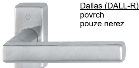
Dallas (DALL-R) povrch pouze nerez