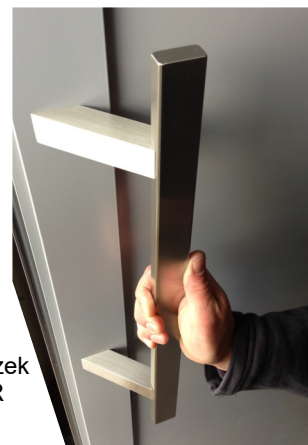
ilustrativní obrázek madlo typ FZHR