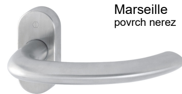
Marseille povrch nerez