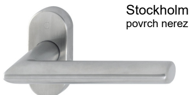
Stockholm povrch nerez

použití: samostatné venkovní madlo venkovní zámková rozeta oválná volitelně viz. nabídka rozet vnitřní klika na oválné rozetě + jednostranný spec. 4 hran 8 mm vnitřní zámková rozeta oválná