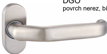
DGO povrch nerez, bílá