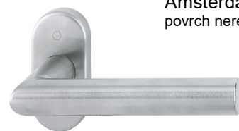
Amsterdam povrch nerez