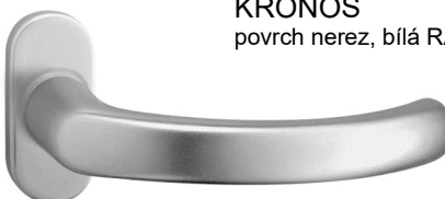
KRONOS povrch nerez, bílá RAL

montáž jednostranné (vnitřní) kliky = speciální 4hran 8 = pouze pro kliky na oválných a obdélníkových rozetách kliky na čtvercových a kulatých rozetách mají v rozetě již vlisovaný (pevný) čtyřhran