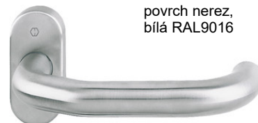
Paris povrch nerez, bílá RAL9016