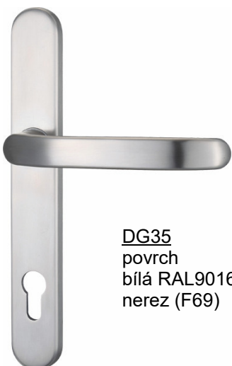
DG35 povrch bílá RAL9016 nerez (F69)