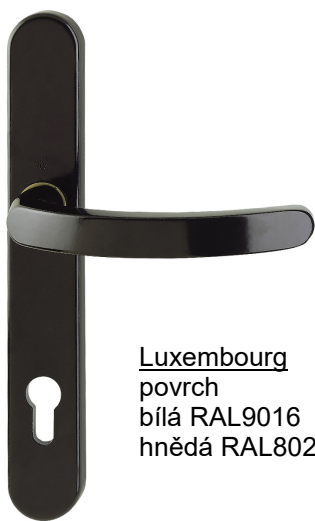
Luxembourg povrch bílá RAL9016 hnědá RAL8022

použití (sestava, set): venkovní madlo na štítu (štít nemá překrytí PZ) klička na štítu viz. samostatná nabídka setů