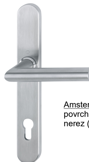
Amsterdam povrch nerez (F69)