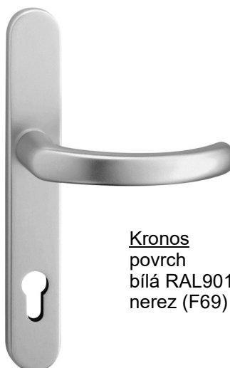
Kronos povrch bílá RAL9016 nerez (F69)