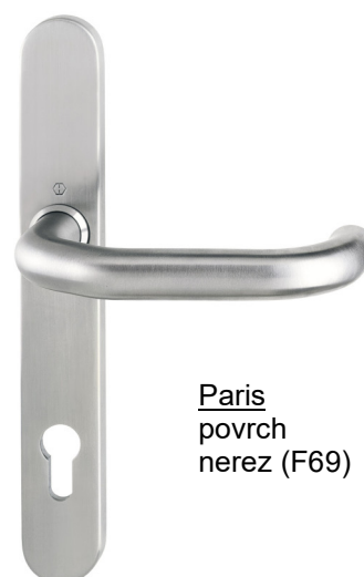
Paris povrch nerez (F69)