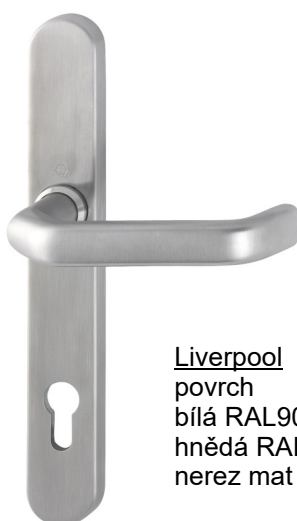
Liverpool povrch bílá RAL9016 hnědá RAL8022 nerez mat (F69)